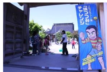
プロゴルファー猿「旗つつみ」チャレンジ

主催 氷見市商店街連盟、氷見市 後援 氷見商工会議所、(一社)氷見市観光協会、ひみ番屋街 お問合せ 氷見市観光交流・若者と女性の夢応援課 Tel.74-8036 (一社)氷見市観光協会 Tel.74-5250